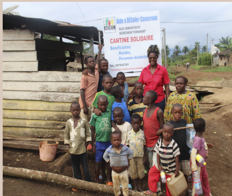
Antes de la construcción de la casa, ADEC se involucró y reforzó el tejido comunitario de Melong II para atender necesidades básicas, como este comedor solidario.

Melong II es una población situada en el centro del país de casi 40.000 habitantes, de los cuales más del 50 % tiene menos de 14 años. Un 33% de los cameruneses sobrevive con menos de 1 euros al día y un 80% de la población activa trabaja en el sector primario. Esto resulta en unos índices de alfabetización y asistencia socio-sanitaria claramente insuficientes, así como el abandono de los niños y la proliferación del trabajo infantil.