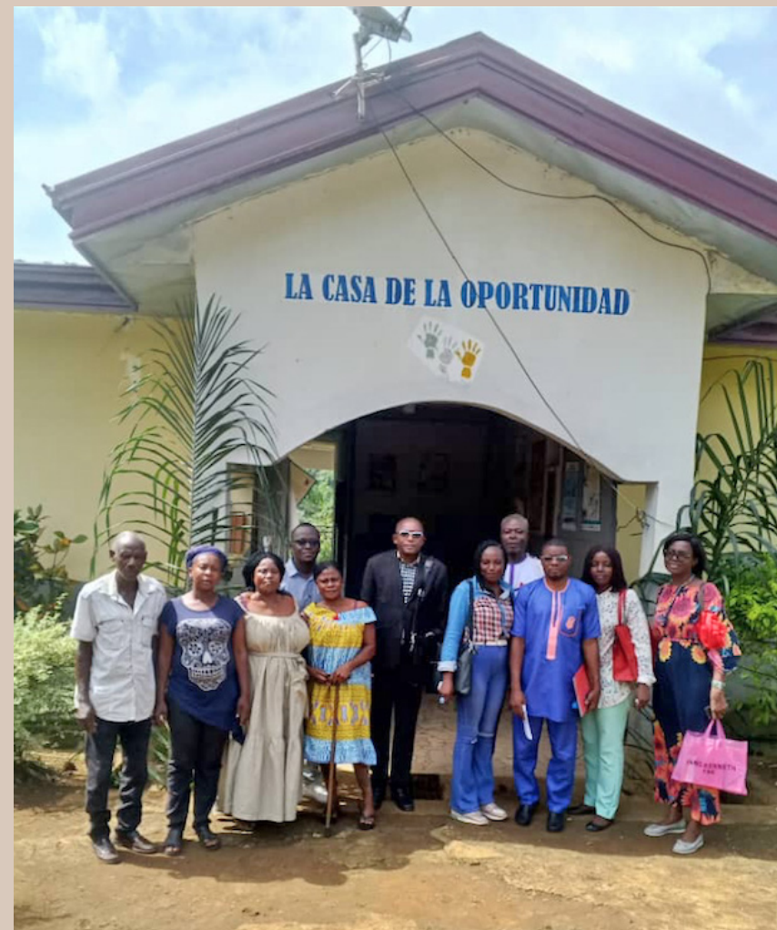
Personal que trabaja actualmente en la Casa de la Oportunidad, junto al delegado del Ministerio de Asuntos Sociales de Camerún.